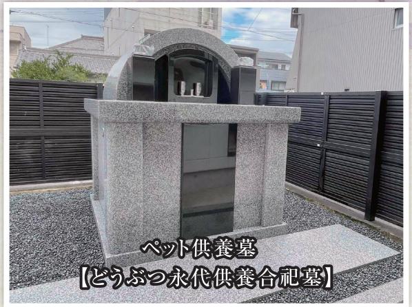
ペット供養墓 【どうぶつ永代供養合祀墓】